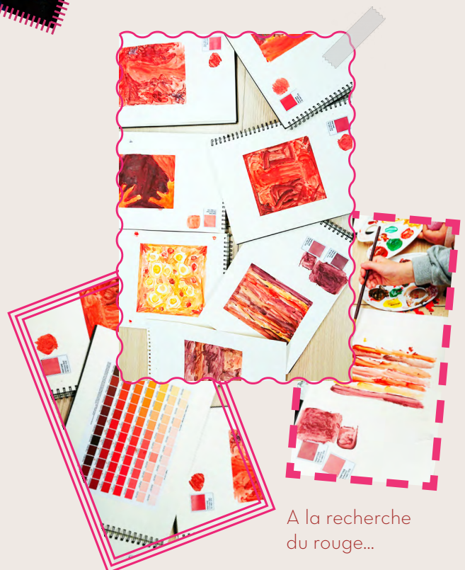
A la recherche du rouge...