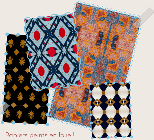
Papiers peints en folie !