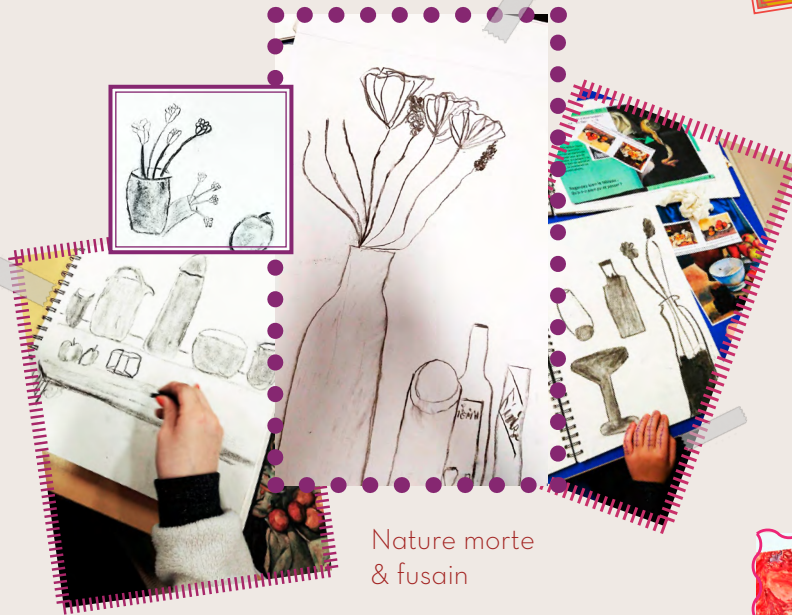
Nature morte & fusain