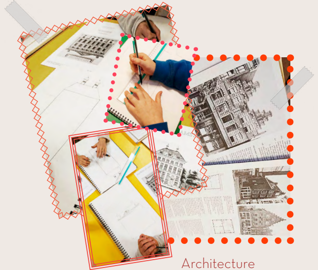
Architecture et perspectives...