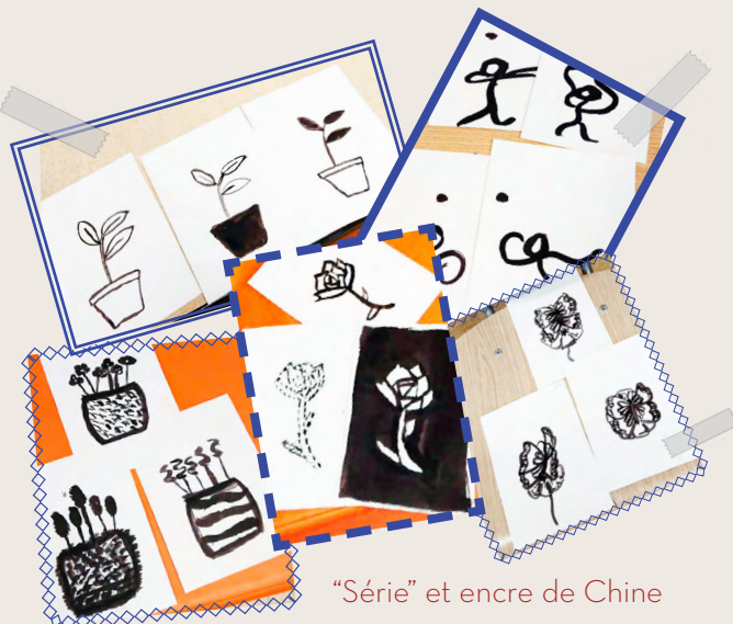
"Série" et encre de Chine